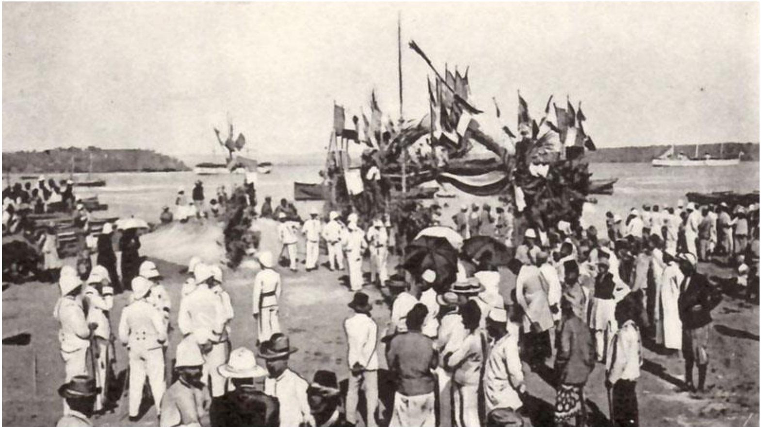
Le port d'Antsirane en 1901