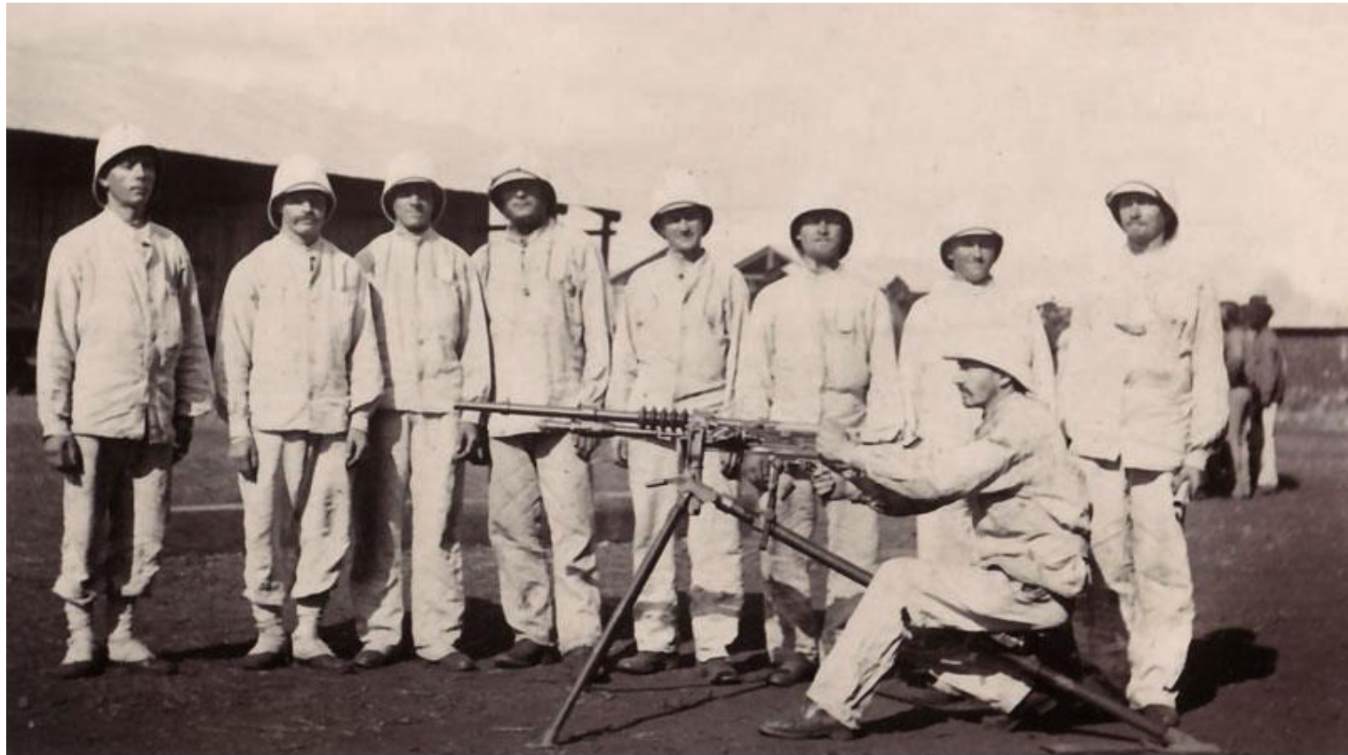
Manoeuvres d'artillerie à Diego Suarez